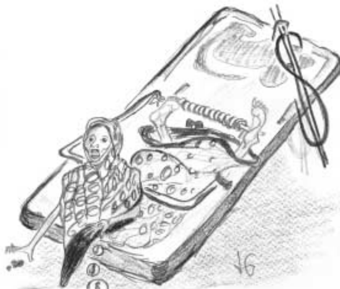
Tegning - Lene Gilby: "Gældsælden".