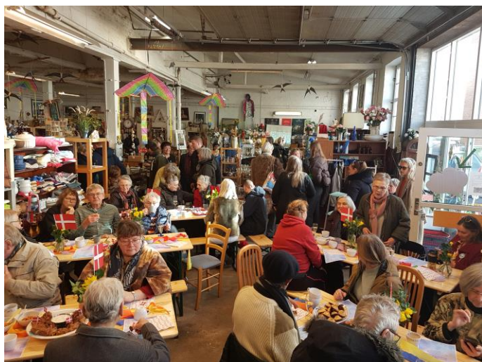
Svalernes jubilæumsreception i Odense 4. marts 2023